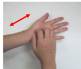
(3) 指先・爪の間をこする