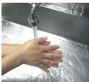
(7) 流水でせっけんと汚れを洗い流す