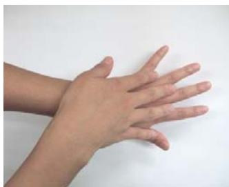
(2) 手のこうを伸ばすように