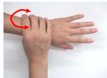
(6) 手首もねじり洗いする