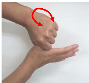
(5) 親指をねじり洗いする