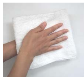
(8) タオルは使い回しをしないこと