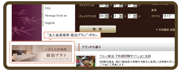
ベストウェスタンホテル高山の"Reservation"ページの画面です。